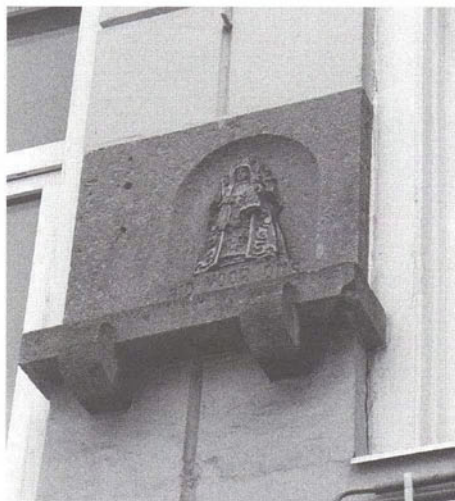
Hinthamerstraat 21/23, beeldje Zoete Moeder in de voor-gevel. In de kleine kelder van dit huis zaten tijdens de bevrijding veel evacués uit Berlicum.

De bouwsporen, de keramische beeldjes van de Zoete Moeder van Den Bosch, die uit dankbaarheid in veel gevels zijn aangebracht, en het Welsh Division Memorial moeten de oorlogsherinneringen levend houden, ook voor de na-oorlogse generaties.