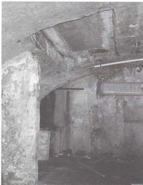
Hinthamerstraat 100 kelder onder het rechter-achterhuis met in het gewelf aangebrachte toegang van het noodziekenhuis.

tingen door vuur aan. Zo heeft de kap van de pastorie Achter de Tolbrug een voltreffer gehad, een spantbeen werd versplinterd. Het vuur kon gelukkig geen vat krijgen op het harde eikehout, zodat deze prachtige houten constructie nog steeds te bewonderen is. Bij de restauratie is het kapotgeslagen spantbeen hersteld. De oorlogsschade is echter zichtbaar gebleven.