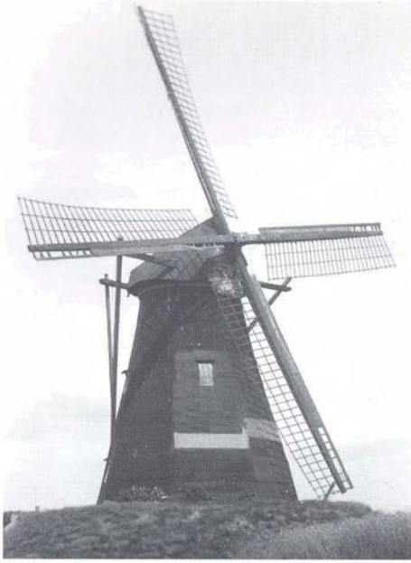
De molen van Vinkel, enkele weken voor de verplaatsing naar Holland-Michigan in 1964. De molen is gedekt met houten beschot, waar teerpapier op aangebracht is.

van Nieuw Amsterdam, wilde men een molen hebben als levend symbool van de banden met Nederland. In 1964 konden de 'Hollanders' de molen 'De Zwaan' in Vinkel voor afbraak kopen, zodat deze andermaal uit elkaar genomen en verplaatst werd. Dit karwei werd uitgevoerd door molenmaker Medendorp uit Zuidlaren (Dr.). Helaas verkeerden de uit 's-Hertogenbosch afkomstige tandwielen toen in een te slechte staat om ze opnieuw te kunnen gebruiken. 12 Wel konden de molenstenen met hun ijzeren spillen opnieuw gebruikt worden in Amerika. De molen op Windmill Island in Holland-Michigan wordt regelmatig in bedrijf gesteld voor het malen van graan. Er draaien dus Bossche molenonderdelen! ■