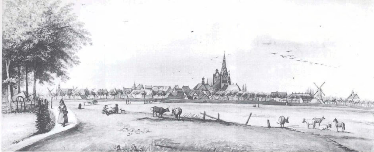
Stadsgezicht vanuit het westen, getekend in 1840. Rechts molen 'Nooitgedacht' op Bastion Maria. Uit handschrift A.G. Verheijen, Bibliotheek Koninklijk Huisarchief Den Haag.

ning was aannemer J. van Lith uit Empel voor f 1640,-. De afbraak duurde van december 1883 tot maart 1884. In opdracht van de aannemer werd het van de afbraak afkomstige materiaal in veiling gebracht. Het bracht gezamenlijk f 1017,25 op. 4 Helaas worden de kavels in de van de veiling op-gemaakte processen-verbaal niet omschreven, noch worden de kopers genoemd. De lage opbrengst wijst er op dat er al onderdelen onderhands waren verkocht.