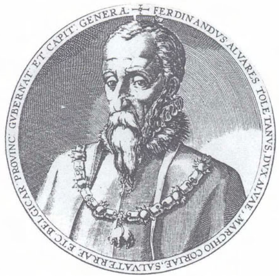
Landvoogd Ferdinand Alvarez de Toledo, hertog van Alba (1507-1582) bemoeide zich ook met de Bossche schepenstoel.

Het resultaat van al deze activiteiten was dat de kanselier tenslotte kon beschikken over een lijst van steeds rond de veertig namen. Tevens kende hij het oordeel van de schout over die kandidaten. Daarnaast wist hij in hoeverre de kandidaten als goed katholiek bekend stonden. De aanbevelingen uit het Bossche zullen voor de kanselier zwaar hebben gewogen. Toch