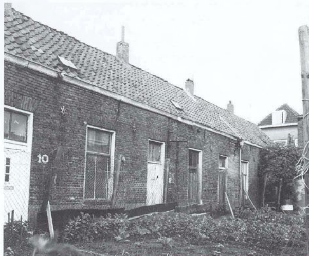
Dezelfde huisjes zoals ze er nog in 1981 stonden.