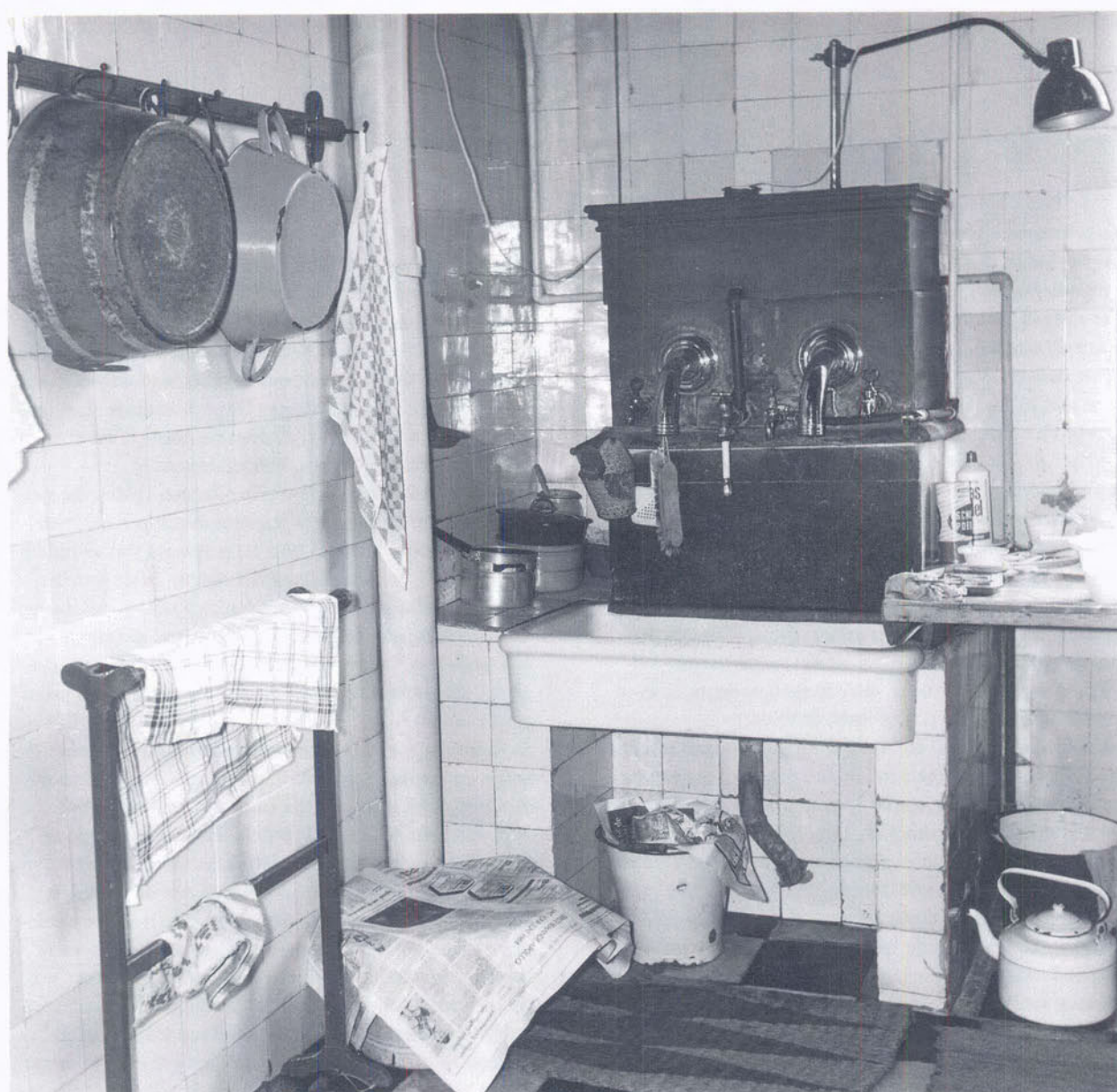
De oude pomp in de keuken van De Munt anno 1967.

Het spoor van Postelstraat 42 gaat terug naar het einde van de vijftiende eeuw. Het achterhuis komt men vervolgens tegen in een schepenprotocol uit 1527. De naam van de toenmalige eigenaar Aelbrecht Proening van Deventher verklaart de vroegere naam: 'Huys van Deventher'. Een welgesteld man die al spoedig een naastgelegen pand aankocht en bovendien twee kleinere achterhuizen bijbouwde, over de Binnendieze heen. Al met al 'eene schoone, welgelegen adellijcke huys, erve, hoff ende achterhuys, opten Uijlenborgh uitkomende'. Het heeft dan ook een reeks van voornamelijk bewoners gekend: burgemeesters en schepenen van de stad, de laagschout, de rentmeester der Staten van Brabant, de griffier van het Bossche Gerechtshof, enzovoorts. Van de echtgenote van de schatrijke raad en pensioaris Otto Copes, die dit huis in 1651 kocht, Vrouwe Josina Schade van Westrum, en haar vijf kinderen is nog een schilderij van de bekende Bossche schilder Van Thulden bewaard gebleven, dat zich thans in het Noordbrabants Museum bevindt, waar het tijdens de tentoonstelling over