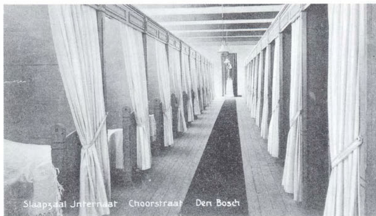
Slaapzaal Internaat Choorstraat Den Bosch

Zoals gezegd kreeg dit gebied ten zuidoosten van de Sint-Jan in de loop van de negentiende en vroege twintigste eeuw een geheel nieuw aanzicht. Naast de plebanie en de