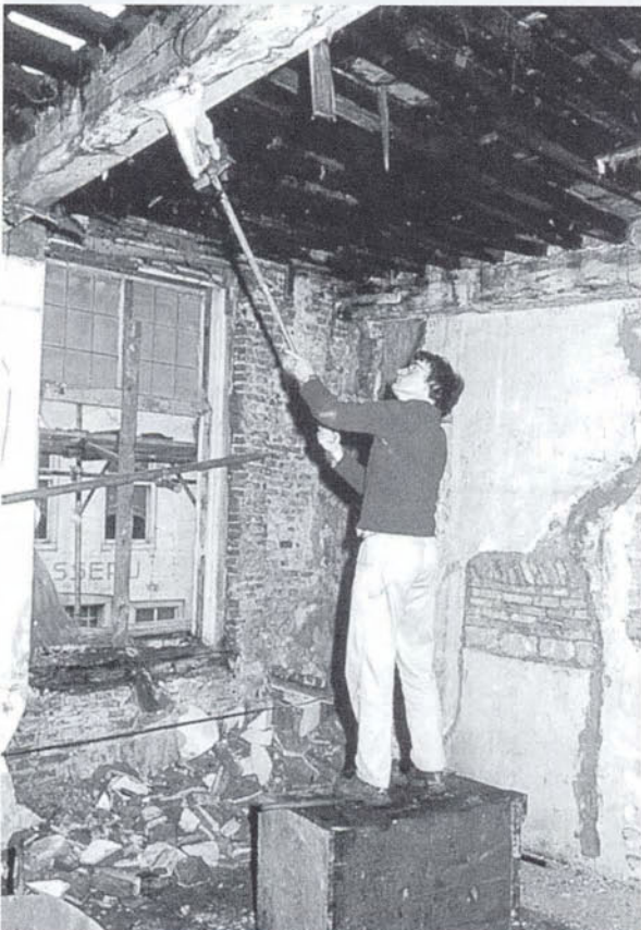
Onderzoeken is ook handwerk

'Het kenmerk van wat hier in Den Bosch op bouwhistorisch gebied is ontstaan, is samenwerking. Het historisch stadskernonderzoek van Den Bosch is niet iets van één discipline. Het zijn verschillende disciplines, zoals daar zijn de geschreven bronnen en de archeologie. Tussen die twee heeft de bouwhistorie haar plaats gekregen als schakel tussen de ondergrondse bronnen van de archeologie en de geschreven bronnen.'