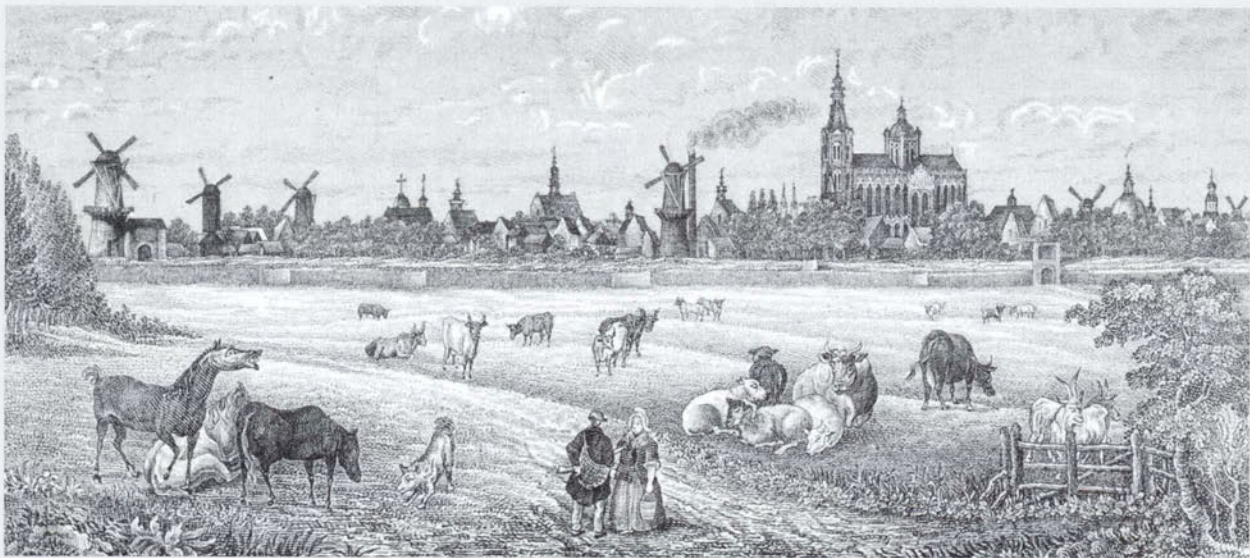
Afb. 1. Gezicht op 's-Hertogenbosch vanuit de Bossche Broek met de molens op de wallen, ca. 1850. Steendruk van J.P.Tesson, tekenaar onbekend.

restauratie van de Binnendieze. De restauratie van de vestingwerken zal archeologisch en bouwhistorisch een onderbelicht aspect van de historische stedelijke bedrijvigheid kunnen ophelderen: de molens die vanaf het eind van de 16e eeuw op de wallen stonden.