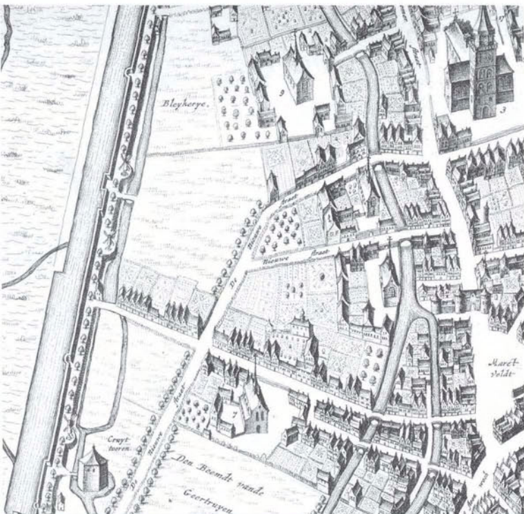
Afb. 2. Detail kaart van Blaeu (1649) met de molens van Van Casteren (midden) en van het Geefhuis (boven). Rechtsboven de Sint-Jan, rechtsonder de Markt.

opkomst van door stoommachines aangedreven meelfabrieken aan het eind van de 19e eeuw werden molens overbodig. Ze zijn successievelijk afgebroken. In 1939 werd het restant van het laatste exemplaar, de molen van Van Esch, op Bastion Deuteren, gesloopt. Daarmee verdween de molen definitief uit het Bossche stadsbeeld. 1