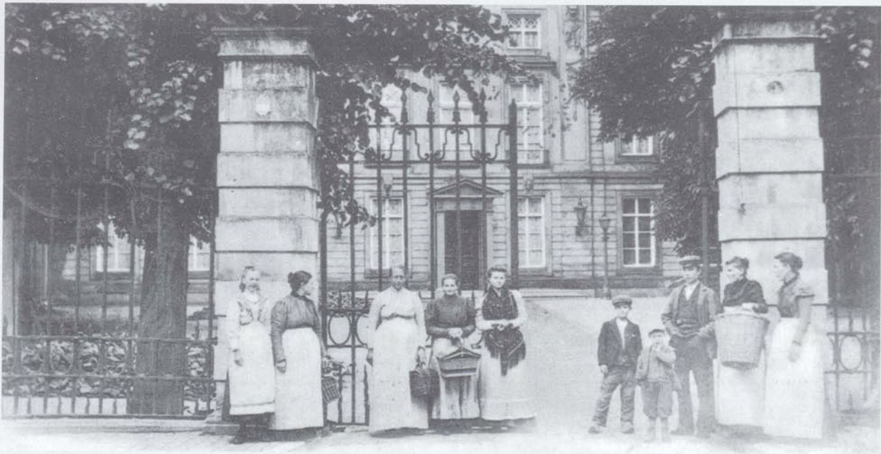
Gouvernement – later Noordbrabants Museum –, met belangstellende Bosschenaren ca. 1890