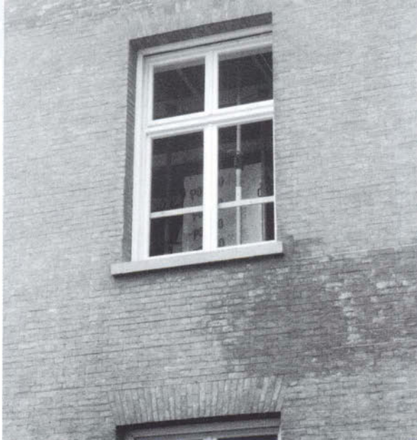
De nieuwe ramen aan de Choorstraat in januari 2002