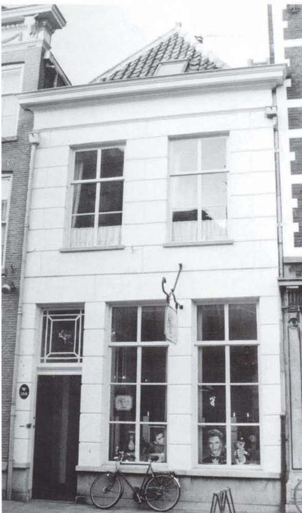
Hinthamerstraat 158, een goed geproportioneerde gevel met harmonische raamindeling