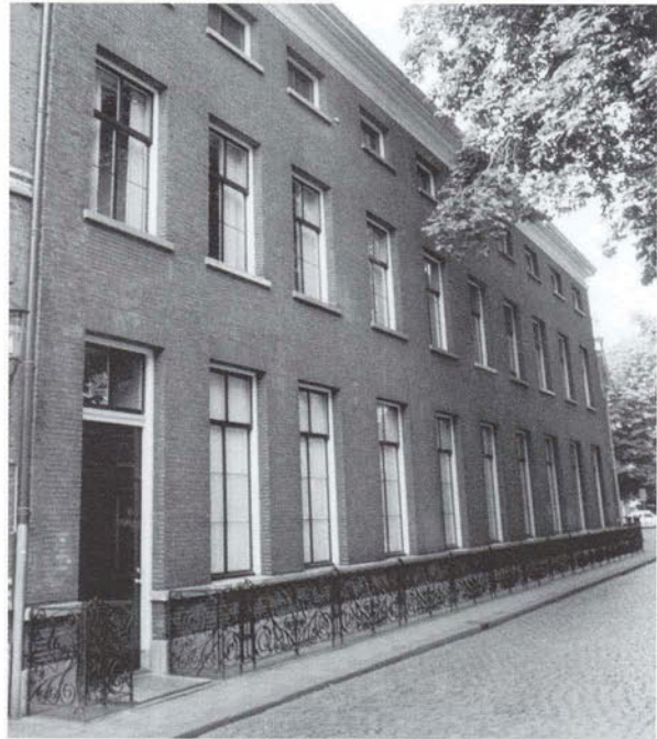
Choorstraat 7, gevel in de oorspronkelijke staat, 1998

nu blijkt dat ze worden vervangen door nieuwe draai- en kiepramen. Producten van de timmerfabriek met modern comfort en dubbel glas, die de verfijnde verhoudingen volledig missen. Blijkbaar is dit onderdeel van het plan op onnaspeurbare manier ontkomen aan de ogen van instanties als welstand en monumentenzorg. Een onvergeeflijke fout, temeer omdat enkele tientallen meters verder bij het etablissement De Keulse Kar een rel is ontstaan over hetzelfde probleem: bestaande goede ramen die vervangen zijn door nieuwe met verkeerde verhoudingen. De exploitant klaagt over 'gemeentelijke muggenzifterij' omdat de profielen twee centimeter te dik zijn. Jazeker, twee centimeter maakt bij harmonisch afgewogen raamindelingen uit het verleden een enorm verschil. Een wandelaar met gevoel voor geschiedenis kan kijkend naar de Bossche gevels haarfijn het onderscheid maken