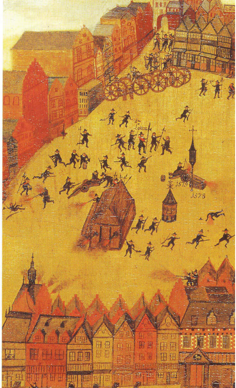
Gedeelte schilderij van Jan Roelofs van Diepenbeeck van het Schermersoproeroer in 1579. We kijken richting Leuvensepoort. Op de Markt de schandpaal en de waterput. Voorts wordt er gevuurd vanuit een wachthuis (?). (Origineel en foto: Noordbrabants Museum)

Je kunt je voorstellen, dat de 'eerste' waterput met zijn zeshoekig puthuis uit de eerste helft van de 15e eeuw eerst op maquette wordt uitgevoerd. In de 17e eeuw is deze put afgebroken en op zijn fundament is er een pomp gebouwd, die later weer is vernieuwd. Uiteraard brengt het gemeentebestuur ook allerlei hedendaagse praktische argumenten in kaart: vervuiling, bestendig-