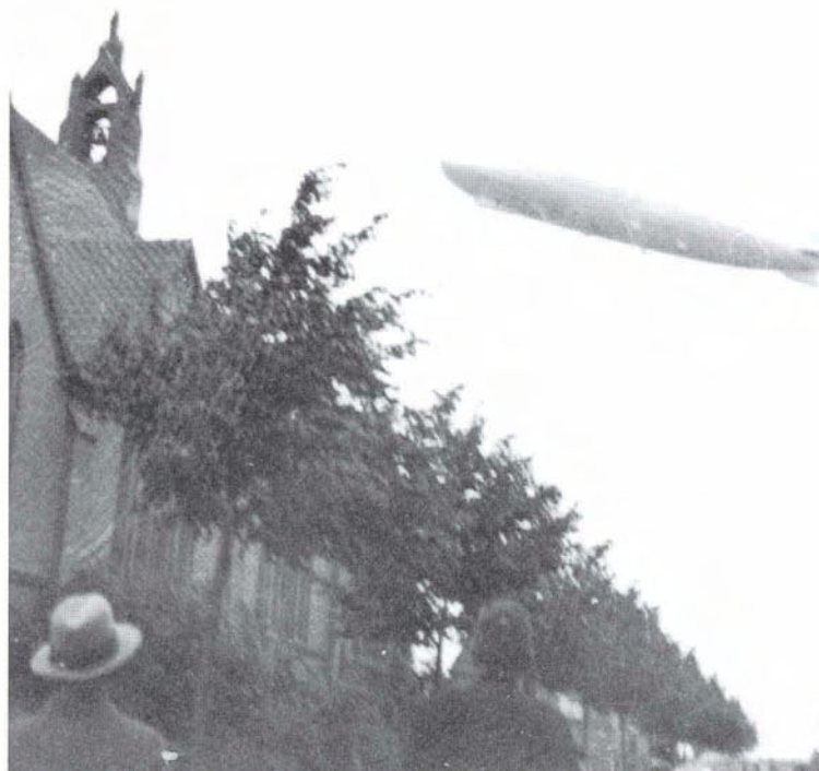
Van dhr. Veenstra ontving het Stadsarchief een unieke opname van de 'Graf Zeppelin' die in juni 1932 enkele ogenblikken boven de Geert van Woustraat zweefde. Links de zijgevel van de Sint-Antoniuserk.

Eind jaren twintig van de vorige eeuw zijn de hoogtijdagen van luchtschepen. Het bouwen van veilige schepen kost echter veel tijd. Met nieuwe motoren dienen uitgebreide proefvluchten gemaakt te worden alvorens de schepen in de reguliere dienstregeling ingezet kunnen worden. Het paradepaardje van 'Luftschiffbau Zeppelin' in Friedrichshafen is de Graf Zeppelin (LZ-127). Deze onderhoudt een regelmatige dienst met Zuid-Amerika. Eventuele extra vluchten dienen dus in deze dienstregeling ingepast te worden. Om de Graf Zeppelin als het ware