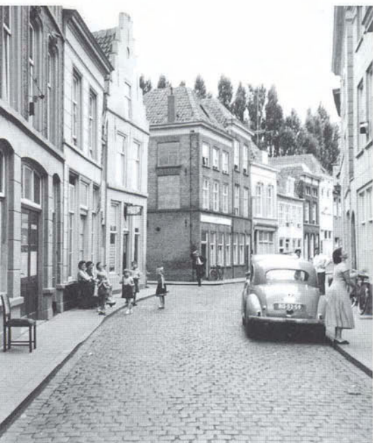
De Lange Putstraat toen kinderen gewoon op straat konden spelen (ca. 1955)

‘aan de vezel’ of ‘aan de wol’ geverfd, en was de duurste manier, want ze kostte de meeste verf. Maar het leverde ook de mooiste en meest kleurvast geverfde stoffen op. De uitdrukking ‘door de wol geverfd’, gezegd van iemand die heel goed bekend is met iets, is ontspoord en luidde eigenlijk ‘aan de wol geverfd’. Het verven van wol, op welke manier dan ook, was een kapitaalintensieve onderneming, vanwege de dure grondstoffen en installaties die nodig waren. De procedures waren bovendien arbeidsintensief en vereisten veel kennis en nauwkeurigheid. Dit alles maakte dat het verven 60% uitmaakte van de kostprijs van wollen stoffen, en ook dat lakenververs in aanzien stonden, meer dan de vollers. Sommige ververs specialiseerden zich speciaal op het blauwverven. Hun handen namen nogal eens een blauwe kleur aan. Hun huizen hadden niet zelden namen als De Blauwverver of De Blauwe Hand . 1