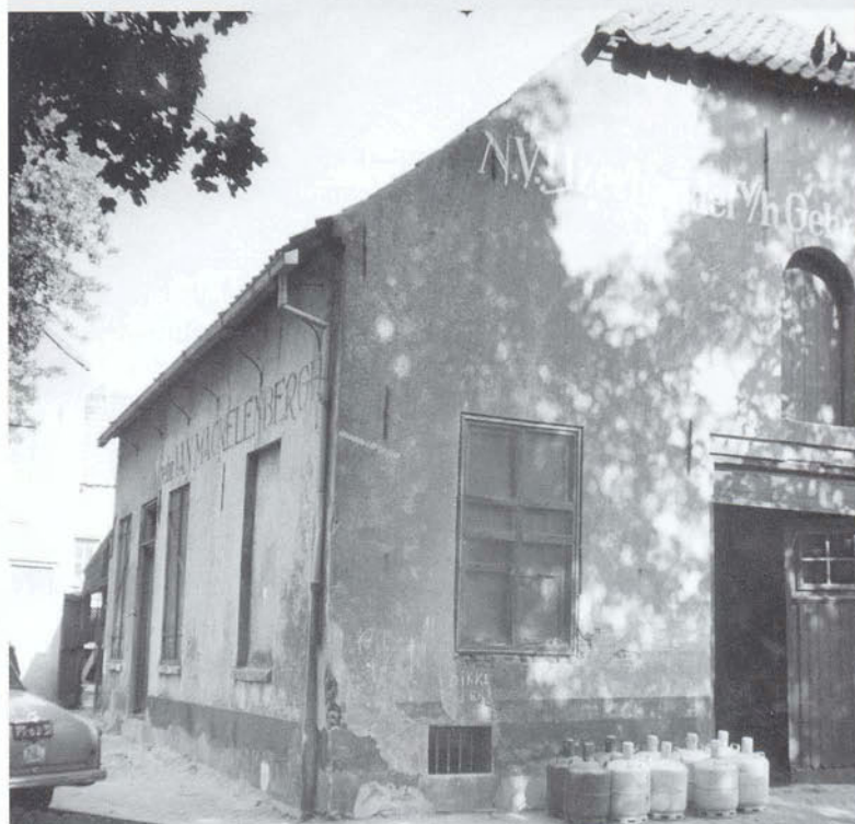
Op het Sint Janskerkhof stond vroeger deze boerderij. Toen de foto genomen werd (1959) was het pand bezit van de Gebr. Van Mackelenbergh; thans ‘St. Janshuis’.

Naast dit soort specialistische onderzoeken doet BAAC ‘alle projecten die aantasting van monumentale historische gebouwen of de archeologische ondergrond moeten voorkomen’. Wat dit betreft zijn de tijden ten goede veranderd. ‘Er komt in een historische omgeving geen bouwplan meer van de