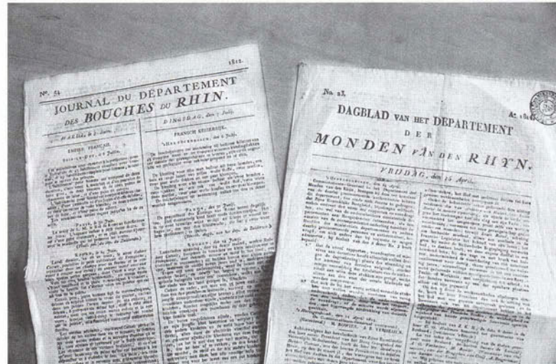
Bossche kranten uit 1812 en 1814