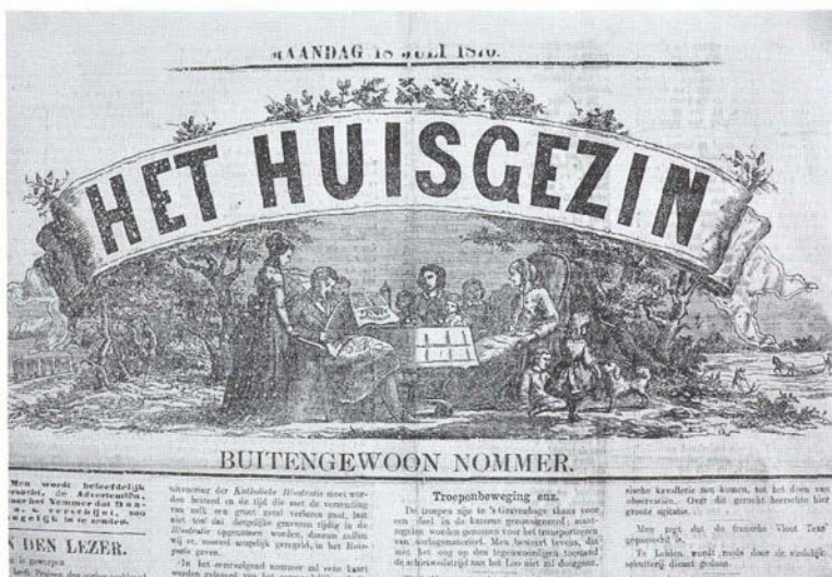
Het 'Huisgezin' van 18 juli 1870 met als belangrijkste bericht dat Frankrijk aan Pruisen de oorlog verklaard heeft.

blad. 'Dit blad, dat haar ontstaan te danken had aan het groeiende verzet tegen het progressieve katholieke kamerlid Schaeppman, kende een duidelijk conservatieve inslag, maar desalniettemin werd een fusie aangegaan met De Noord-Brabander .' De nieuwe naam: De Noordbrabantse – Noordbrabantsch Dagblad . 'Ook van deze krant mag gezegd worden dat ze de sociale actie in krantkrachtig steunde.'