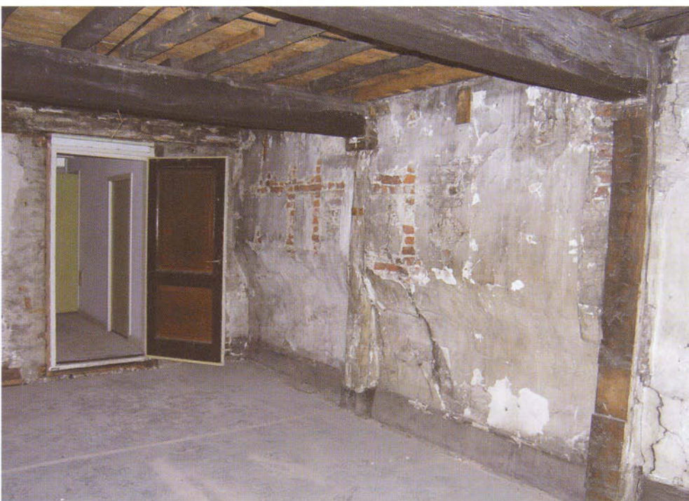
De 'overkraging' van het naastgelegen pand zorgt op de tweede verdieping van Markt 35 voor een verspringing in de zijmuur. Zie ook de foto op p.39 van deze aflevering.