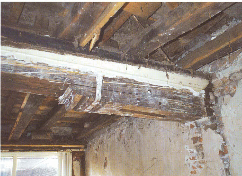
Balklagen in de Kolperstraat, met versierde console en pengat van een houten skeletconstructie.

Het pand van de bakker bezit een gepleisterde lijstgevel aan de straatzijde met op de begane grond een houten pui uit de jaren dertig van de vorige eeuw. Boven de verlaagde plafonds zijn in het achterhuis enkele samengestelde balklagen, bestaande uit moerbalken en kinderbinten, gevonden. De vijftiende en zestiende-eeuwse samengestelde balklagen bevatten nog sleutelstukken en sporen van houten muurstijlen. Op de begane grond en de verdieping zijn afgehakte muurbogen waargenomen in de veertiende-eeuwse zijmuren. In het voorhuis zijn de samengestelde balklagen in de negentiende eeuw vervangen door enkelvoudige balklagen. Verder is een vloerschildering te voorschijn gekomen op de enkelvoudige balklaag van de eerste verdieping aan de bovenzijde van de vloerdelen. Deze dateert van het einde van de negentiende eeuw. Enkele kaarsnissen en dichtgezette openingen verschenen in de ontleisterde wanden. Het oorspronkelijke tongewelf van de kelder is bij een eerdere verbouwing verdwenen.