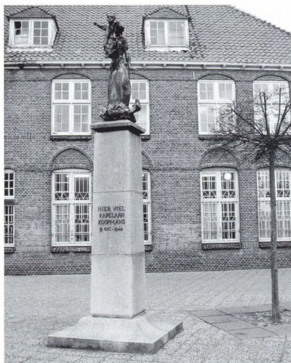
In 1956 geplaatst gedenkteken voor de pastorie aan het Kapelaan Koopmansplein