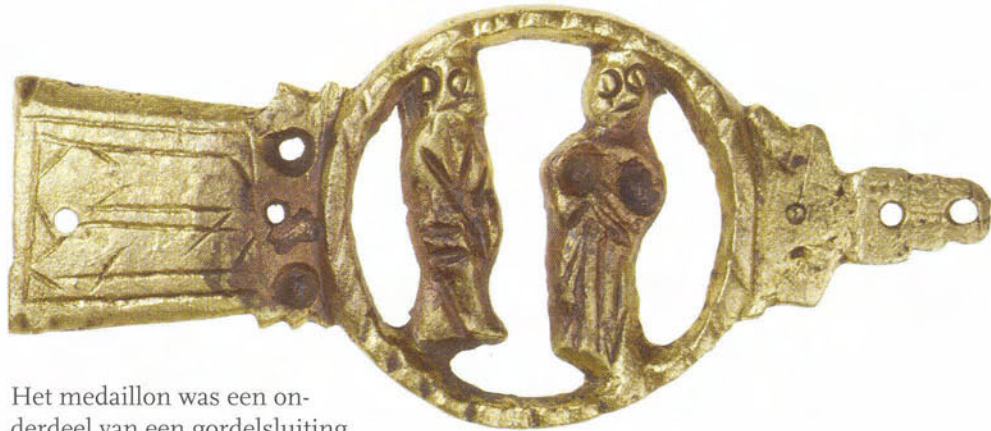
Medaillonsluiting van opgraving Mariënburg, voorzijde.

Het medaillon was een onderdeel van een gordelsluiting. Het behoort daarmee met gespen, riemtongen (de met metaal beslagen uiteinden van leren riempjes) en allerlei gordelbeslag tot de meest frequent voorkomende metalen voorwerpen. Ze hebben gemeen dat ze samenhangen met de kleding. Veel meer dan nu was in de late Middeleeuwen de kleding het belangrijkste middel om sociale verschillen tot uitdrukking te brengen. Vooral de daarop aangebrachte sieraden, insignes en andere leren en metalen beslagstukken gaven iemands sociale stand en positie aan. Hierbij waren voorwerpen uit edelmetaal en (half)edelstenen uitsluitend gereserveerd voor de geestelijkheid, de adel en het patriciaat. Stedelijke kledingvoorschriften verboden vaak zelfs het dragen van deze sieraden door andere sociale groepen. Aan hen waren goedkopere materialen zoals messing, gestanst koperbeslag en lood-tin toegestaan.