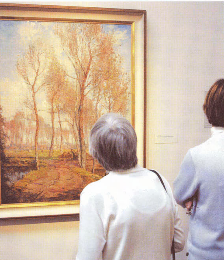
Bezoekers genieten van de 'Omgeving van de rivier de Nethe bij Meershout' (1948). Frans Slager schilderde veel in de omgeving van zijn Belgische woonplaats.