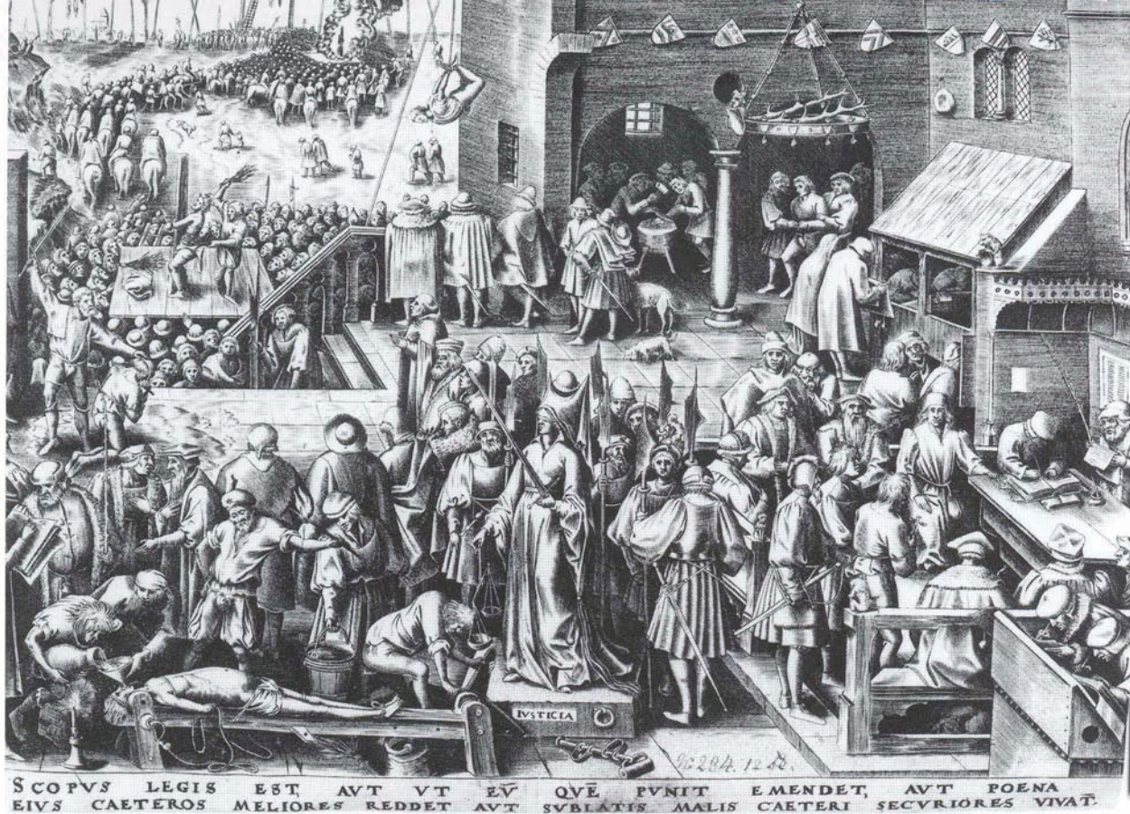
'Iusticia' van Philip Galle (1554), gravure gebaseerd op een tekening van Pieter Brueghel uit 1539. Rond de geblinddoekte vrouwe Justitia is het verloop van een juridisch proces in de zestiende eeuw verbeeld. Links vooraan de foltering van de verdachte door oprekking, volgieten en schroeien (met de kaars in de hoek). Rechts vooraan leest de schout het vonnis voor in de vierschaar met de schepenen en gerechtsschrijvers. Op de achtergrond worden onder grote belangstelling straffen voltrokken als onthoofding, geseling, ophanging aan de wipgalg en verbranding. Achteraan het galgenveld met de galgen en raden waar de lijken blijven hangen ter afschrikking. (Noordbrabants Museum, foto: Stadsarchief, Koos Post)

men. Aan de personen die op dit geschreeuw afkwamen, toonde zij dan haar gescheurde kleren en verwarde haren en maakte zo duidelijk dat de dader zich met geweld aan haar had vergrepen en zij zich daartegen had verzet. Daarna liet zij ook aan schout en schepenen zien dat zij het slachtoffer van een verkrachting was geworden. Dit is het moment waarop de weergave van ons proces begint. De beschrijving moet dienen als een model voor procedures inzake verkrachting in het algemeen. Het eerste wat vervolgens gebeurde was het indienen van een formele aanklacht tegen de verkrachter. 2 De klacht moest daarna bevestigd worden door een aantal eerbiedwaardige en betrouwbare personen. Het stadsrecht van 1284 eiste dit ook uitdrukkelijk.