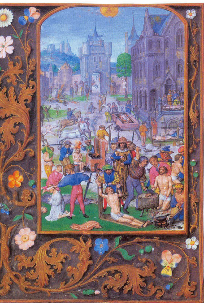
Miniatuur met martel- en executiescènes als illustratie bij het 'officie der martelaren' (ca. 1525) (Antwerpen, Museum Mayer van den Bergh)