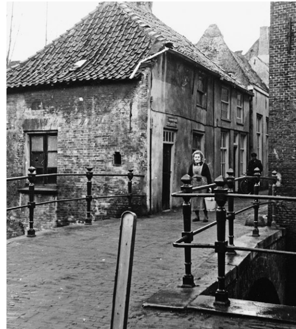
Uilenburgstraatje, brug over de Binnendieze (ca. 1955).

De naam Uilenburg wekt natuurlijk associaties met uilen. Toch hebben deze vogels waarschijnlijk niets met de Uilenburg te maken. Roelands heeft, met veel voorzichtigheid overigens, de theorie gelanceerd, dat de naam Uilenburg samen zou hangen met het koren, dat in die buurt, door de Sint Janspoort, de stad binnenkwam, en