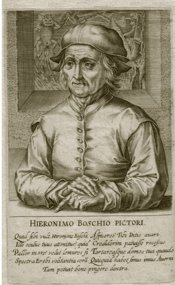
Afb. 3. Hendrick Hondius, Portret van Jheronimus Bosch, 's-Gravenhage 1610.