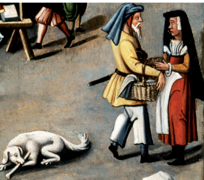
Vrouw onderhandelt met man. Zoals alle andere vrouwen op het bekende schilderij van de laatmiddeleeuwse Lakenmarkt, waar deze scène van afkomstig is, draagt de afgebeelde vrouw geen sluier. De vrouwen op het schilderij lijken allen een zelfstandig bestaan te voeren. Ze drijven handel en kopen stoffen in. (Noordbrabants Museum)