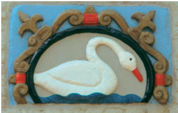
In het boek wordt ingegaan op de relatie van de Illustre Lieve Vrouwe Broederschap met zwanen . De zwaan is in de Middeleeuwen en de vroegmoderne tijd veelvuldig afgebeeld. Het was een 'nathals' en daarom werd de vogel vaak als uithangbord en gevelteken door een herbergier gebruikt. De afgebeelde zwaan staat in de gevel van het huis 'De Swaen' in de Molenstraat.

vaart. Dan verwacht je als lezer van De ontwikkeling van de stad (hoofdstuk 2) dat de auteur wat over de 17e, 18e en 19e eeuw vertelt. Kops is echter van mening dat in die eeuwen geen 'ontwikkeling' plaatsvond, geeft 'de gelijkbenige driehoek van Plato' alle ruimte en is dan plotsklaps in 1874 beland, het jaar van de Vestingwet.