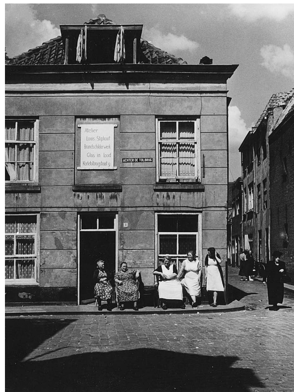
Achter de Tolbrug, hoek Korte Tolbrugstraat. Een opname van Martien Coppens. (Foto: Stadsarchief)

immers overbodig was geworden. Toen ontstond er een langere straat vanaf de Markt: het begin was de huidige Marktstraat; verder liep ze langs de huidige Arena en dan, geleidelijk iets naar het oosten buigend, door tot aan de nieuwe stadsmuur, aan de tegenwoordige Kasterenwal. De Bosschenaar kon nú voortaan wat verder doorlopen voordat hij op de stadsmuur stuitte. De deels nieuwe lange straat kreeg de naam Tolbrugstraat , die we vanaf 1469 in de schepenprotocollen aantreffen, maar al veel eerder door ophoging bouwrijp gemaakt en bebouwd werd. 8 Soms wordt in de protocollen duidelijk onderscheid gemaakt tussen 'die grote Tolbrugge' en: 'achter die Tolbrugge' aan 'dat cleyn Tol-