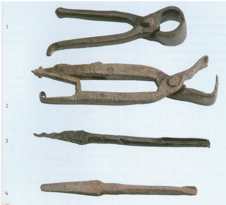
Aangetroffen gereedschappen uit de late middeleeuwen. Sint Jozef, timmerman, hanteerde 'identiek' houtbewerkgereedschap, zoals te zien is op het rechterpaneel van het Merode-altaar door de meester van Flémalle, circa 1425.

geproduceerd gebruiksardewerk, het opgegraven vijftiende-eeuwse zusterklooster Sint Elisabeth Bloemkamp en tenslotte de laatmiddeleeuwse materiële cultuur zoals die naar voren komt uit de naar omvang, variatie en conditie zeldzaam goede collectie metalen mobilia (vooral religieuze en profane insignes).