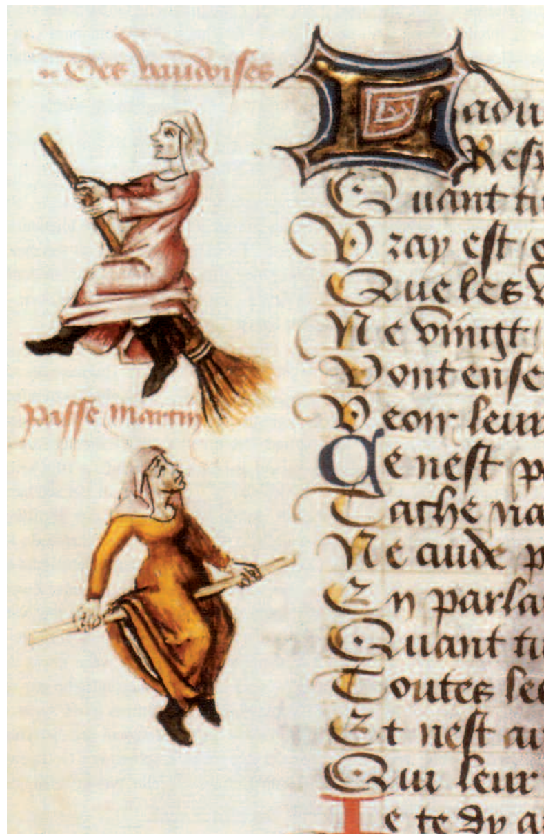
Heksentafereel uit 'Le Champion des Dames' dat rond 1440 werd geschreven. De auteur, Martin Le France, neemt het hierin op voor vrouwen.