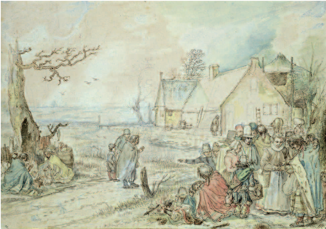
Hendrick Avercamp († Kampen 1634), beroemd om zijn winterlandschappen met schaatsende landgenoten, schilderde hier temidden van de 'keurige' burgerij een zigeunerfamilie. Rechts leest een zigeunerin de hand van een vrouw. (Hamburg, Kunst-halle)