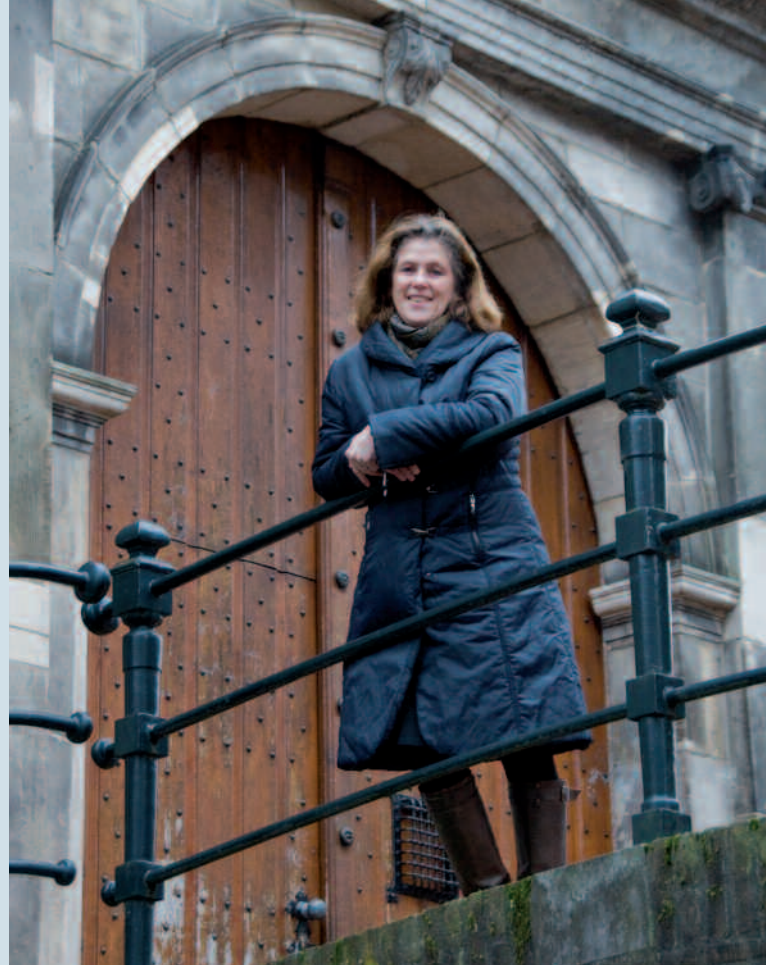
Voor de poort in de Gasthuisstraat.

‘De eerste boeken heb ik nog in elkaar zitten plakken. Want computers kenden wij niet in die tijd. Voor ik op de computer overging, heb ik eerst nog een fax gehad om de (tekst)proeven op en neer te sturen naar de zetters. De stroken zetsel moest ik op vellen plakken. Erg arbeidsintensief. Dat kun je je nu niet meer voorstellen. Die vellen werden dan