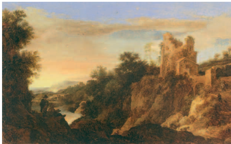
Nummer 87 vermeldt een 'landscapke' van Pieter de Molijn (1595-1661). Alhier afgebeeld: 'Zuidelijk berglandschap met tekenaars' uit 1656 van dezelfde schilder.