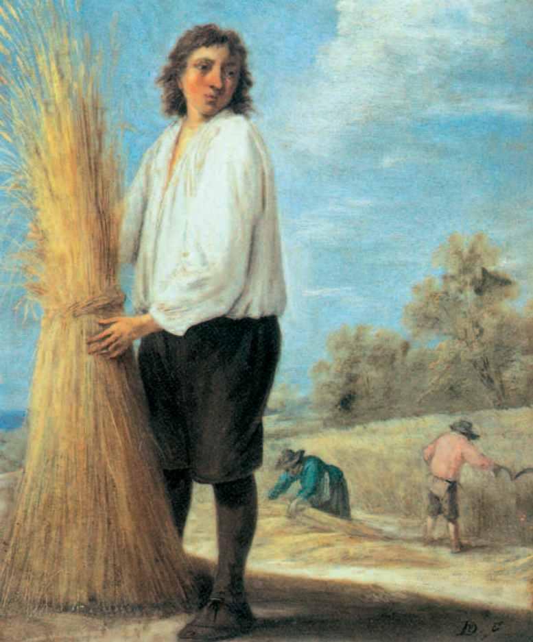
De Vier Jaargetijden, een geliefd thema (boedel nr. 17). Afgebeeld 'De Zomer' door David Teniers de Jonge, 1610-1690. (Londen, National Gallery)