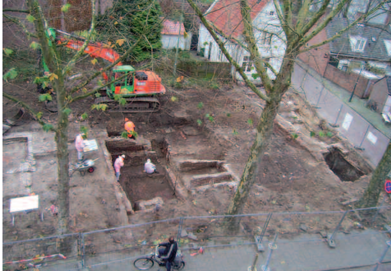
Afb. 4. Opgraving aan de Beurdsestraat in de binnenstad van 's-Hertogenbosch. Hier is duidelijk te zien dat vlak onder het maaiveld resten aanwezig zijn van kelders, vloeren en muren. De resten reiken vaak tot meters onder het maaiveld. Onderzoek naar deze overblijfselen van eeuwenlange bewoning is ingewikkeld en arbeidsintensief.

Het nieuwe beleid heeft voor- en nadelen. Initiatiefnemers draaien thans op voor de kosten van het onderzoek en worden daarmee veel nauwer betrokken bij het belang van ons cultuurhistorisch erfgoed. Omdat zij moeten betalen voor onderzoek zullen ze proberen dit te beperken door de resten zoveel mogelijk in de bodem te houden. Daarmee wordt er meer in de bodem behouden voor toekomstige generaties. Een nadeel is dat de marktwerking en de controle die daarmee gepaard gaat een toename betekent van het aantal regels en controle-