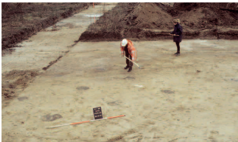
Afb. 5. Opgraving aan de Bundersteeg ten noorden van Rosmalen. Voorafgaand aan de aanleg van de Grote Wielen zijn hier opgravingen uitgevoerd waarbij resten van huizen uit de IJzertijd (800-50 v. Chr.) en Romeinse tijd (50 v. Chr.- 400 n. Chr.) zijn aangetroffen. Deze resten bevinden zich dicht onder het maaiveld en tekenen zich af als donkere verkleuringen in het zand.

stappen. Uiteindelijk wordt er wel van elk onderzoek een rapport gemaakt dat voor iedereen beschikbaar is. Daarmee komen meer gegevens over ons verleden beschikbaar en wordt onze kennis vergroot. Bovendien kunnen de vondsten een inspiratiebron vormen voor nieuwbouwplannen en de inrichting van de openbare ruimte waardoor ons verleden voor iedereen beter zichtbaar wordt.