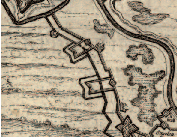
Afb. 3a. Uitsnede van een kaart van het beleg van 's-Hertogenbosch in 1629. Tussen Engelen (rechts onder) en Crevecoeur (links boven) zijn twee schansen te zien. Nu ligt hier de Henriëttewaard.