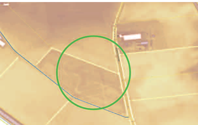
Afb. 3b. Hoogtebestand van een deel van de Henriëttewaard. Links van de weg zijn de contouren te herkennen van één van de schansen uit 1629.

omgesprongen. In de praktijk betekent dit, dat wanneer iemand iets wil bouwen op een plaats waar archeologische sporen in de bodem zitten, hij moet proberen deze zoveel mogelijk te ontzien. Als dit niet kan moet hij het onderzoek betalen zodat de informatie kan worden vastgelegd.