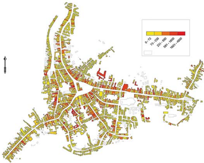
Beeld van de verdeling van rijkdom en armoede in de stad (hoe roder hoe rijker). (Niet opgenomen in de dissertatie, zie werkdocumenten op www.ua.ac.be/main.aspx?c=jord.hanus bewerking: Nika grafische vormgeving, Vught)

Een diepgaande ruimtelijke analyse van de gegevens bleek voor zijn proefschrift uiteindelijk niet nodig. In het artikel 'Mapping Sixteenth-Century 's-Hertogenbosch' uit 2008 zet Hanus wel uiteen hoe